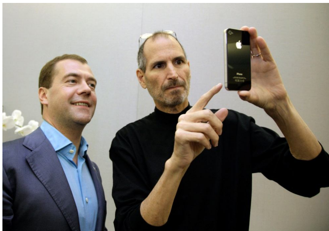
Рис.4 Третий президент России Дмитрий Медведев во время общения со Стивом Джобсом при посещении фирмы Apple (США)

перспективным направлениям подобно американской Кремниевой долине в Калифорнии. Во время официального визита в США для Дмитрия Медведева была организована специальная поездка в этот американский центр новых технологий, а также посещение фирмы Apple и общение с её создателем и лидером Стивом Джобсом (рис.4). В наши дни эта инициатива растворилась в общем потоке упреков, критики и санкционной войны против России.