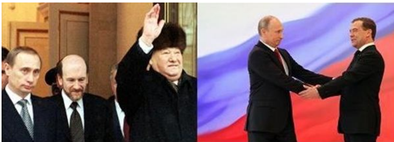
а) б) Рис.5 Передача высшей власти Путину В.В.:

отметить, что оба этих события образуют точку X с датами 1999 и 2011 годов на диаграмме спирали Фибоначчи (рис.2).