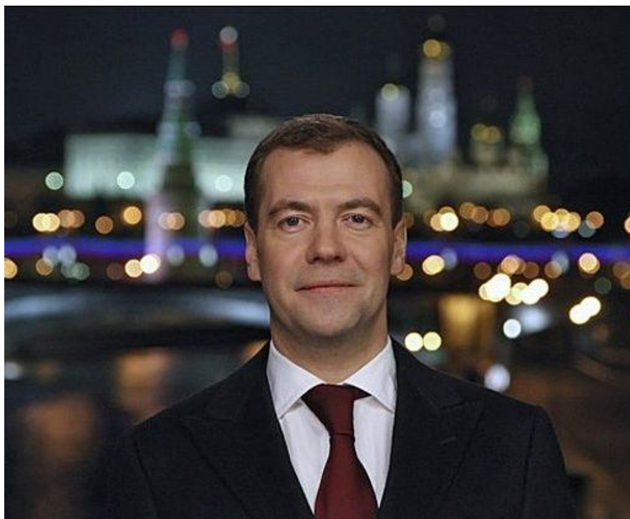
Рис.1 Третий президент России Дмитрий Медведев

Для наилучшего понимания сути эпохи третьего президента России Дмитрия Медведева (рис.1), как и в предыдущих случаях, рассматривается часть спирали Фибоначчи истории России, включающая периоды, начиная с 1985 по 2025 годы.